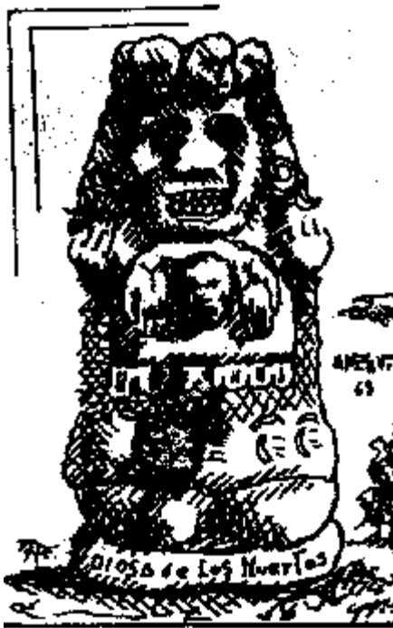
Dios de los muertos

Realmente el elixir de larga vida es un gas blanquísimo, poderoso electropositivo y electronegativo. Cuando el iniciado pide el elixir de larga vida entra en el templo de Sanat Kumará el cual le lee al iniciado todas las condiciones y requisitos sagrados; Sanat Kumará es el fundador del colegio de iniciados de la Logia Blanca, vive en un oasis del desierto de Gobi, con otros iniciados lémures, todos conservan el mismo cuerpo desde