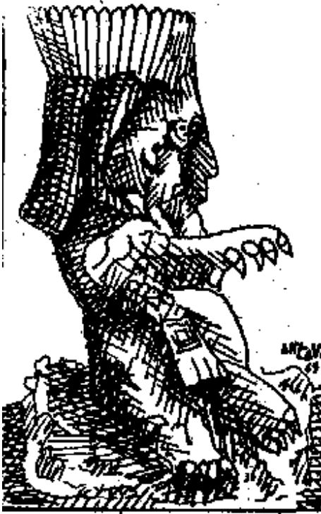
El Dios Murciélago

desencarnan las almas de acuerdo con la ley del Karma, tienen como símbolos al murciélago, la lechuza y la hoz; ellos sacan el alma del cuerpo y rompen el cordón plateado que une el alma al cuerpo.