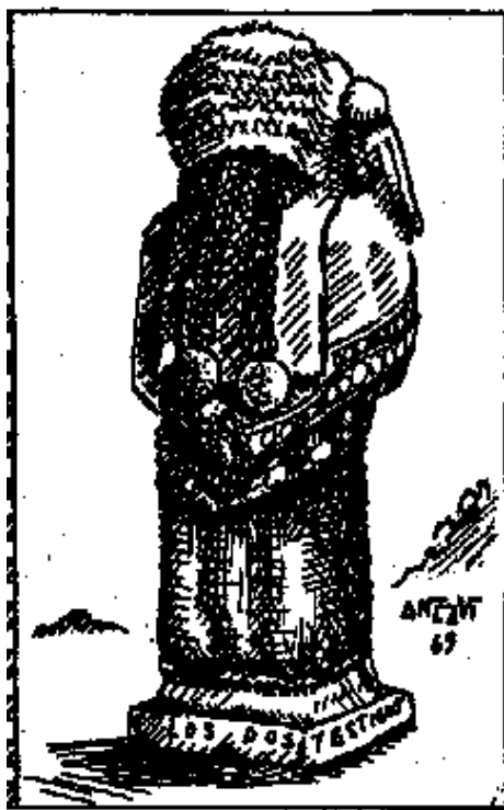
Ilustración (los dos testigos)

”Y me fue dada una caña semejante a una vara y se me dijo: Levántate y mide el templo de Dios, y el altar, y a los que adoran en él” (Cap. II, vers. 1 Apocalipsis).