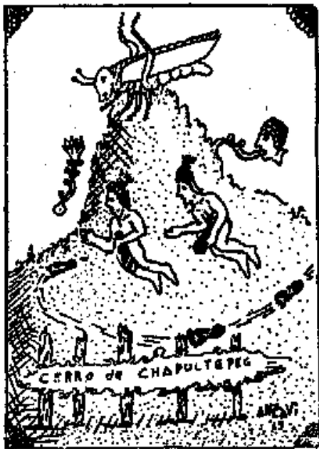
Cerro de Chapultepec

En el presente capítulo vemos un fragmento de un códice indígena mexicano del cerro de Chapultepec. Sobre el cerro vemos un chapulín o grillo. En la Roma augusta de los Cesares el grillo se vendía en jaulas doradas a precios elevados.