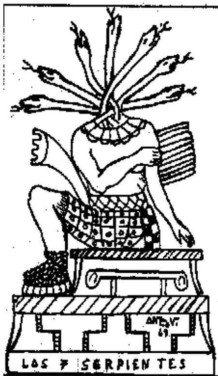
Los 7 Serpientes

un culto muy especial a la serpiente; en los muros invictos de ese misterioso santuario vemos esculpida a la serpiente cascabel.